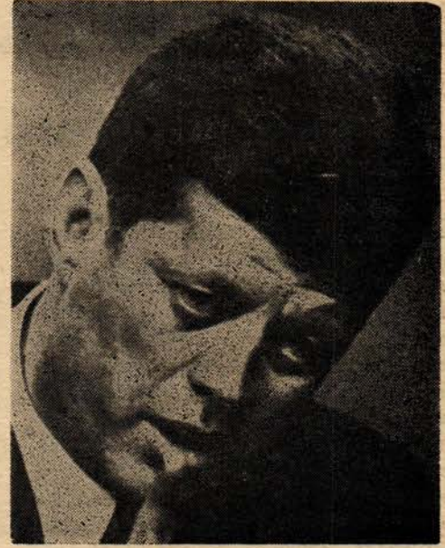
Cesaret ve Fikir

O bütün dünyada; harp sonu nesillerinin, ideallerinin, ümitlerinin, fikir ve düşüncelerinin canlı senbolü idi. İlham ediyordu, yol gösteriyordu, icra ediyordu. Ümitsizlikleri yıkan, harikulâde bir dünyada, emsalsiz bir geleceğin işaretçisi idi. Mil-